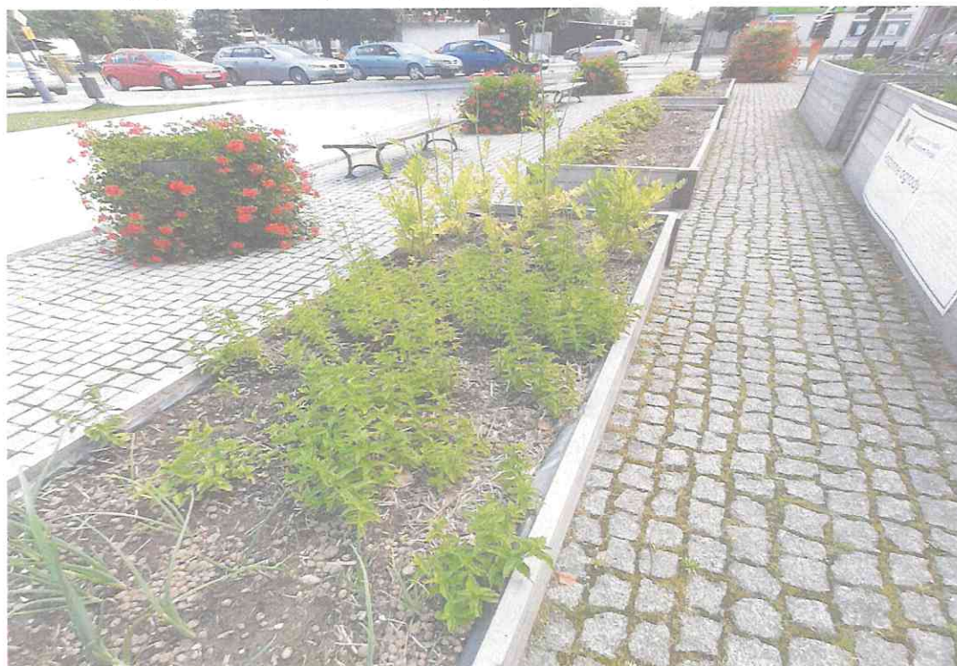
Wizualizacja projektu pt. „ Rodzinne Ogrody w roku 2022”.

W maju 2022 r. na Placu Reymonta w Tuszynie dokonano nasadzeń warzyw w skrzyniach ogrodniczych w ramach podpisanego z Urzędem Marszałkowskim porozumienia o współpracy przy realizacji projektu pn. „Rodzinne Ogrody”. Celem projektu była ochrona naturalnego środowiska przed globalną chemizacją poprzez przywracanie mu pierwotnej równowagi. Rośliny do nasadzeń wybrane zostały zgodnie z zasadą allelopatii, czyli dobrym i złym sąsiedztwem roślin.